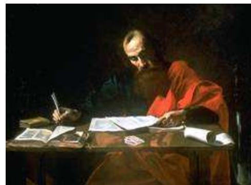
Pablo de Tarso escribiendo sus cartas, obra del siglo XVII