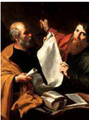
Pedro y Pablo Apóstoles

Pablo de Tarso fue un activo perseguidor de estas comunidades bajo la influencia de los fariseos. De hecho el fue de los que participó y asintió en la ejecución de San Esteban, el primer mártir (denominado protomártir) de la iglesia cristiana de aquel entonces, quien cayera víctima de lapidación no como consecuencia de la barbarie de la multitud, si no como cumplimiento de una ejecución judicial, pues Saulo contaba con la venia de Roma.