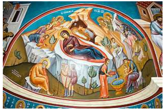
Mural de la iglesia de San Juan Bautista en el río Jordán que muestra el nacimiento de Jesucristo.

La << Navidad >> (latín: nativitas , 'nacimiento') es una de las fiestas más importantes del Cristianismo, junto con la Pascua y Pentecostés, que celebra el nacimiento de Jesucristo en Belén. Esta fiesta se celebra el 25 de diciembre por la Iglesia Católica, la Iglesia Anglicana, algunas otras Iglesias protestantes y la Iglesia Ortodoxa Rumana; y el 7 de enero en otras Iglesias Ortodoxas, ya que no aceptaron la reforma hecha al calendario juliano, para pasar a nuestro calendario actual, llamado gregoriano, del nombre de su reformador, el Sumo pontífice Gregorio XIII