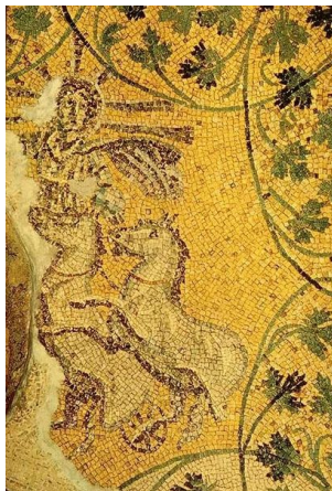
Alegoría de Cristo en forma del dios solar Helios o Sol Invictus Conduciendo su carroza. Mosaico del siglo III d. C. de las grutas vaticanas en la Basílica de San Pedro en el techo de la tumba del Papa Julio I.

La verdadera fecha de nacimiento de Jesús no se encuentra registrada en la Biblia. Por ésta razón, no todas las denominaciones cristianas coinciden en la misma fecha. Los orígenes de ésta celebración, el 25 de diciembre, se ubican en las costumbres de los pueblos de la antigüedad que celebraban durante el solsticio del invierno (desde el 21 de diciembre), alguna fiesta relacionada al dios o los dioses del sol, como Apolo y Helios (en Grecia y Roma), Mitra (en Persia), Huitzilopochtli (en Tenochtitlan), entre otros. Algunas culturas creían que el dios del sol nació el 21 de diciembre, el día más corto del año, y que los días se hacían más largos a medida que el dios se hacía más viejo. En otras culturas se creía que el dios del sol murió ese día, sólo para volver a otro ciclo.