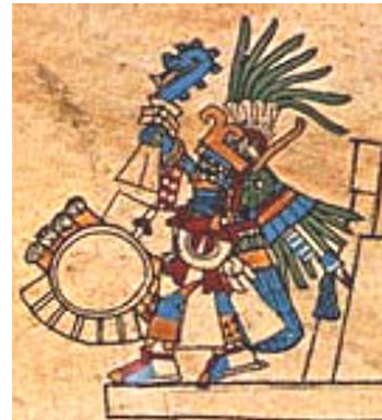
Los aztecas también celebraban el nacimiento de uno de sus dioses en invierno: Huitzilopochtli.

Los mexicas celebraban durante el invierno, el advenimiento de Huitzilopochtli, dios del sol y de la guerra, en el mes Panquetzaliztli, que equivaldría aproximadamente al período del 7 al 26 de diciembre de nuestro calendario. "Por esa razón y aprovechando la coincidencia de fechas, los primeros evangelizadores, los religiosos agustinos, promovieron la sustitución de personajes y así desaparecieron al dios prehispánico y mantuvieron la celebración, dándole características cristianas."